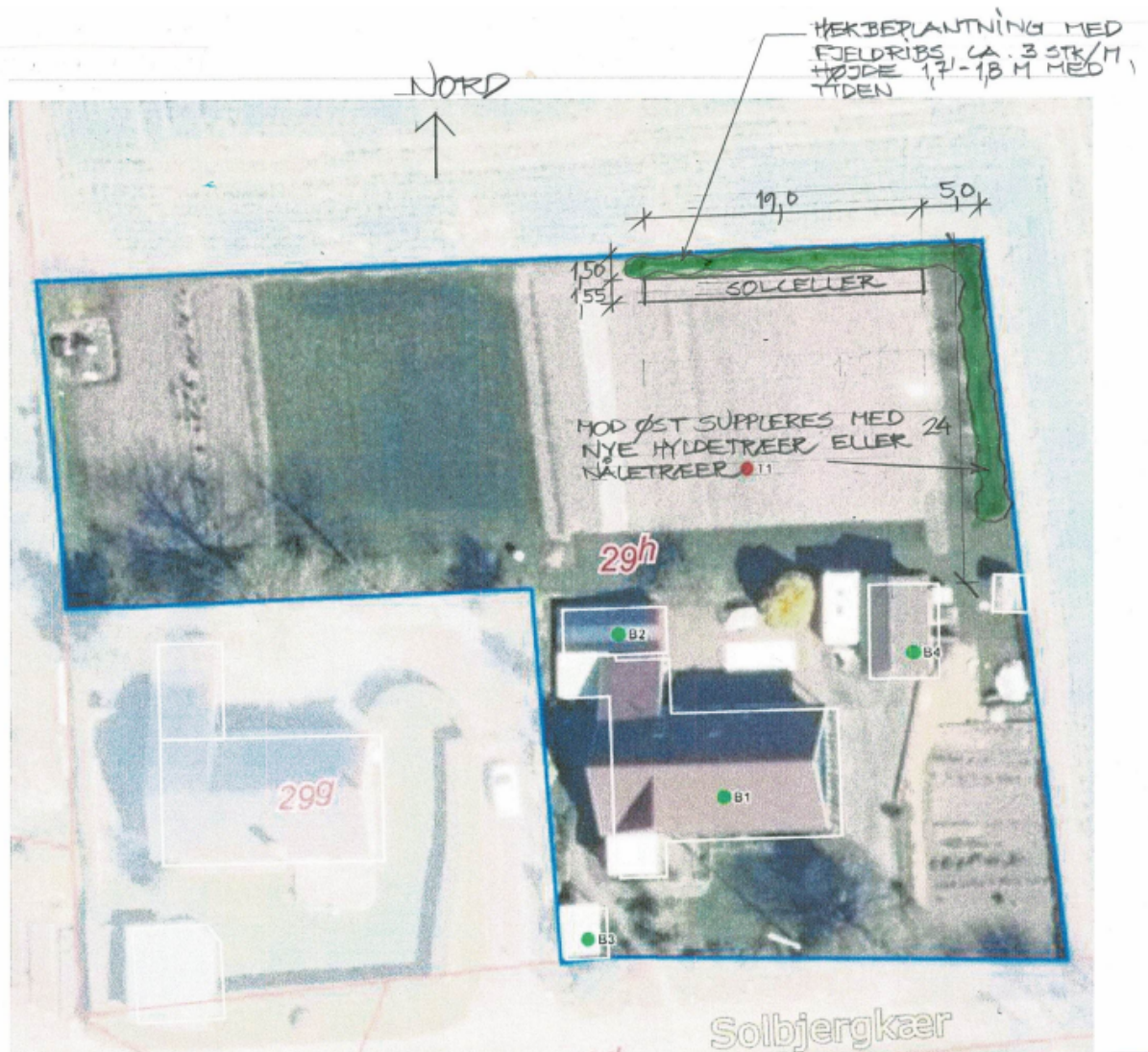
Situationsplan modtaget d. 22. marts 2024